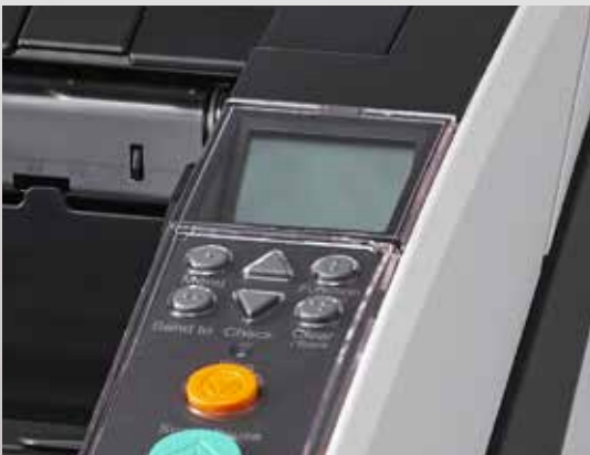
Panel de funcionamiento con pantalla de cristal líquido integrada

Para evitar averías, los escáneres fi-7800 y fi-7900 cuentan con un paso de papel hecho en metal que permanece inalterable con el paso de grandes volúmenes de papel, a diferencia de las estructuras de resina. Un novedoso sistema balancea la carga de papel en la bandeja de salida, lo cual alarga la vida de los componentes y maximiza la productividad.